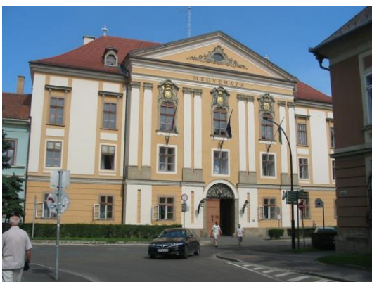
Eger, Megyeháza - Díszterem 3300 Eger, Kossuth Lajos utca